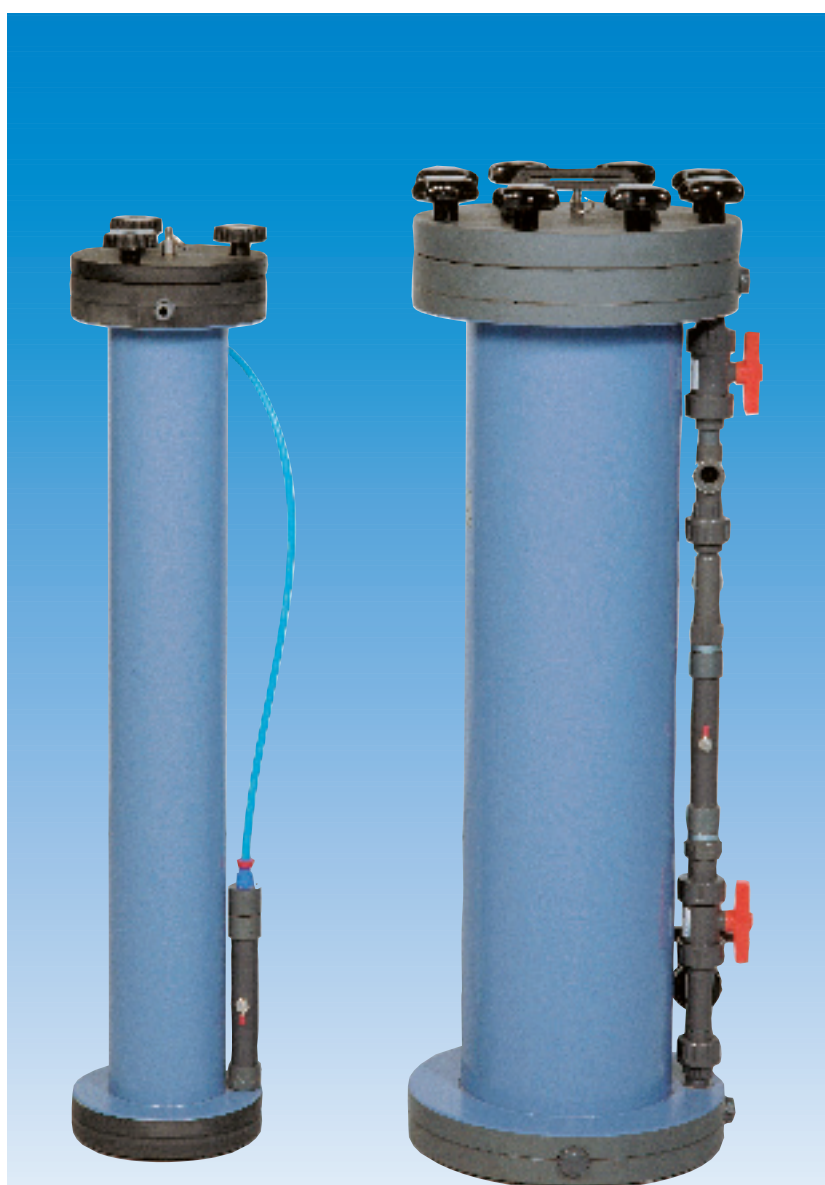
SILEX I B